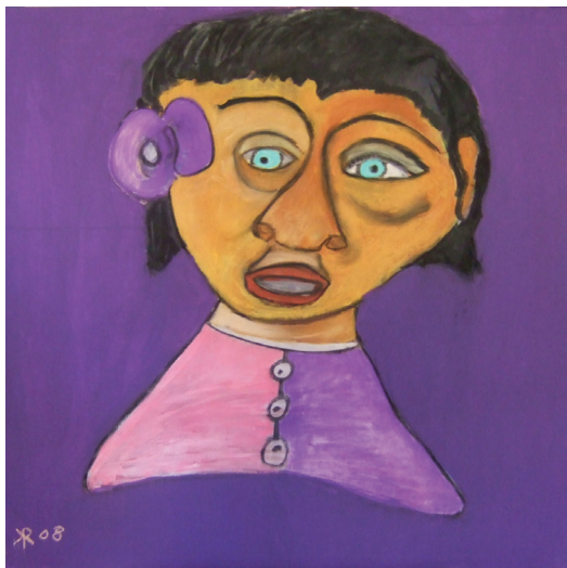
Rolf: Frau mit Blume / Acryl