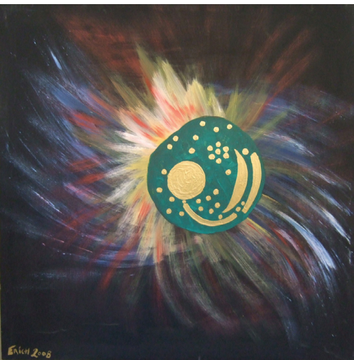
Erich: Himmelsscheibe von Nebra / Acryl