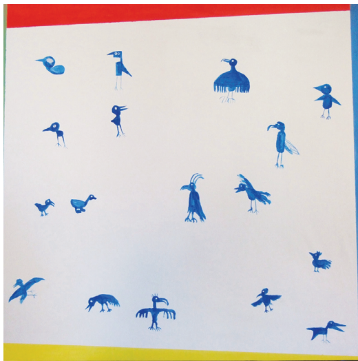
Armin: Von Pleitegeiern und anderen Vögeln / Acryl