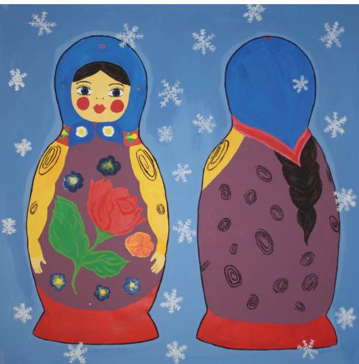
Elena, Matröschka / Acryl